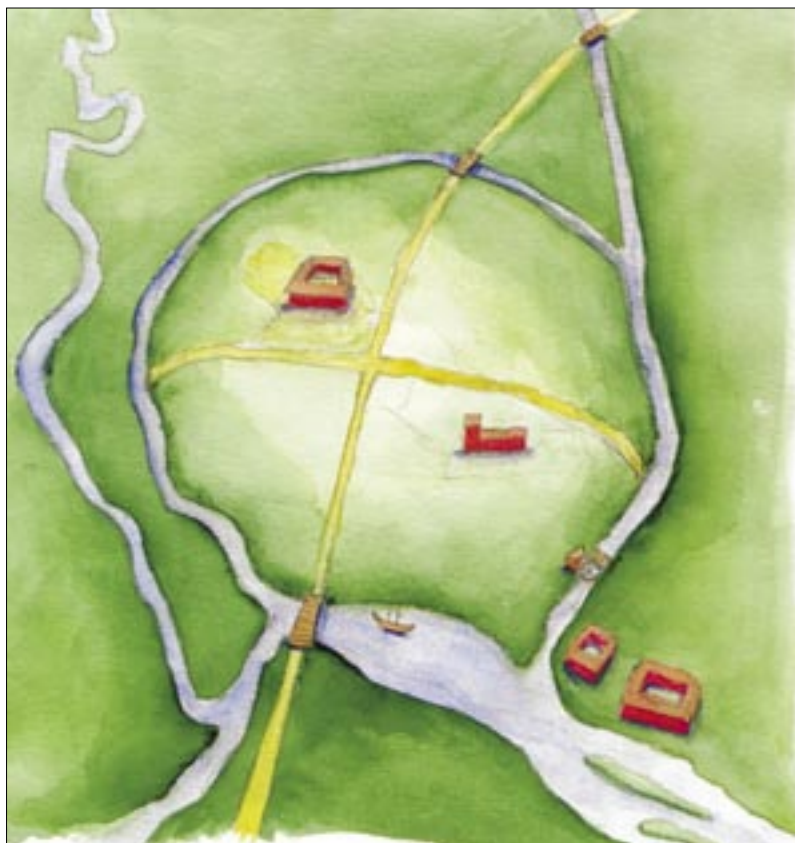
Principtegning af Vejles ældste gadeforløb

Over for Midgårdsbrønden er der en bæk her sidder et par og holder i hånd. Parret kan meget vel være Hestemennesket fra Midgårdsbrønden og Englekatten, dengang de måske var et ungt forelsket par.