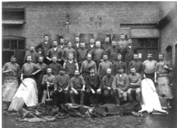
Personalet ved A/S M.J. Ballins sønners garveri før 1913