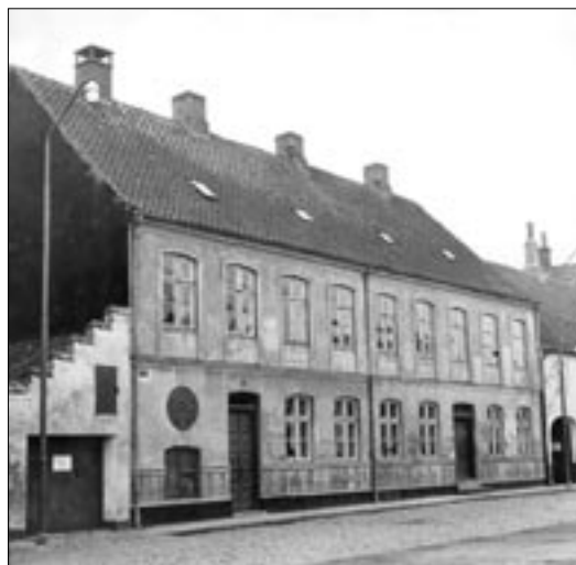
Linnemanns Jomfrukloster omkring 1950

Fattiggården bestod af tre bygninger, det vil sige en bygning med selve fattiggården, en med kontor og inspektørbolig og en med sygeafdeling. I 1933 blev fattiggården ændret til arbejdsanstalt, men allerede i 1938 blev den revet ned, da Dæmningen blev forlænget fra Kirkegade til Sønderbrogade. Sygeafdelingen fik dog lov til at stå og blev brugt til at huse husvilde indtil 1953.