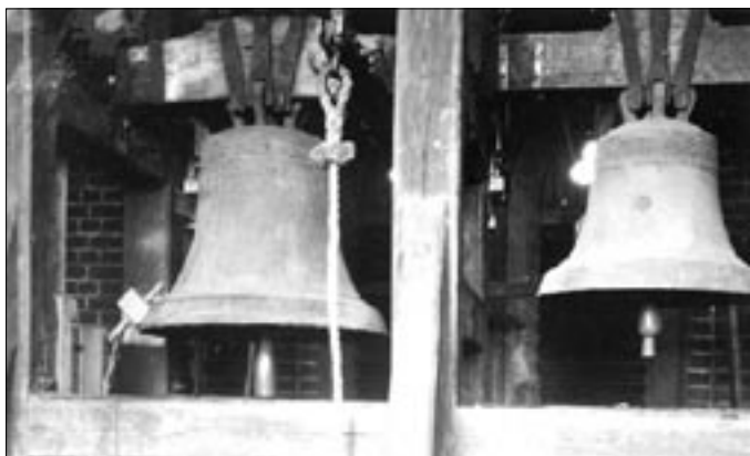
De to klokker i Sct. Nicolai Kirkes klokketårn.