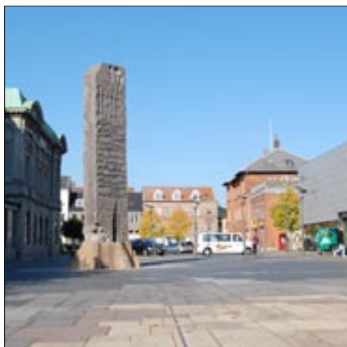
Borgvold ca. 100 år senere

for Vejles videre udvikling som by. Det havde været en hård opgave at argumentere for, at jernbanen skulle føres til Vejle. I 1865 gik arbejdet i gang, og det skulle vise sig ikke at være helt nemt. Det var det sporarlægsarbejde i Danmark, der krævede mest jordarbejde, hvilket medførte mange jordskred og et enkelt dødsfald undervejs. Den 4. oktober 1868 blev jernbanestrækningen Fredericia-Århus åbnet med stor festivitas. Et pyntet tog kørte den 4 timer og 11 minutter lange tur fra Århus til Fredericia med særligt indbudte personer. Mens man ventede i Vejle,