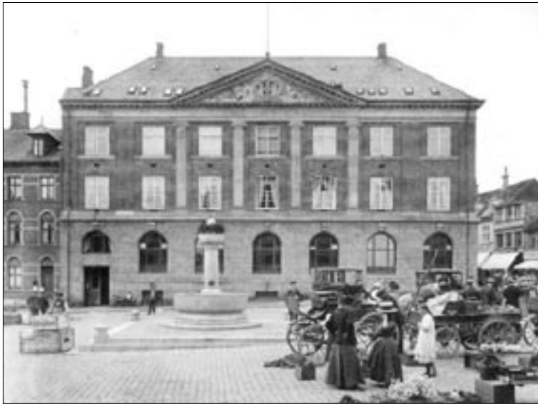
Torvet foran Sct. Nicolai Kirke