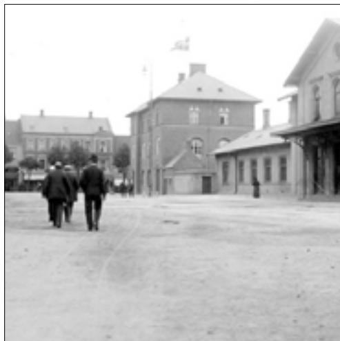
Borgvold mellem 1900 og 1907

Da jernbanen kom til Vejle i 1868, havde det stor betydning