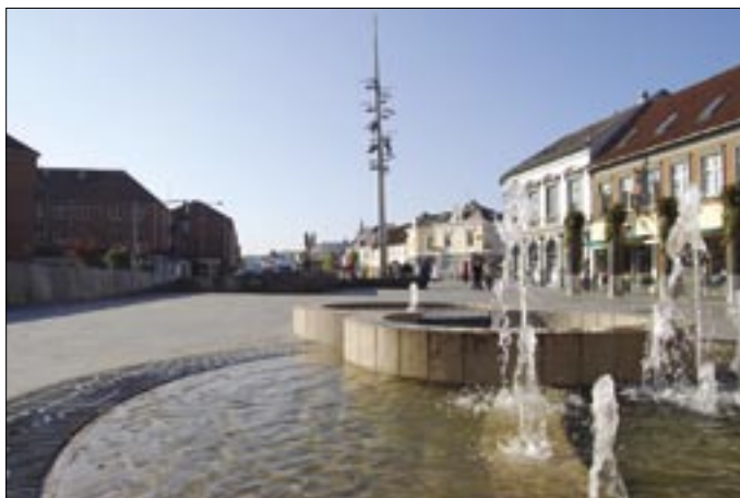
Nørretorv år 2008