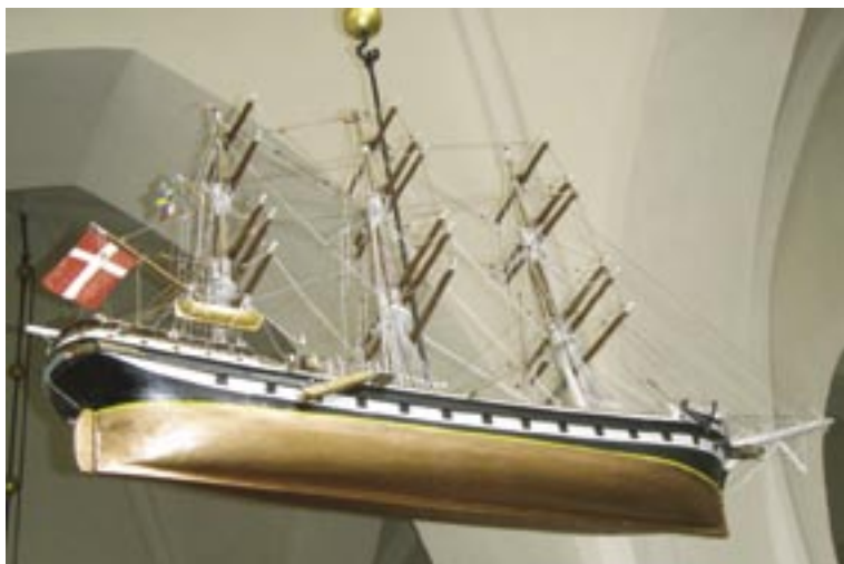
Kirkeskibet Dorthea Marie