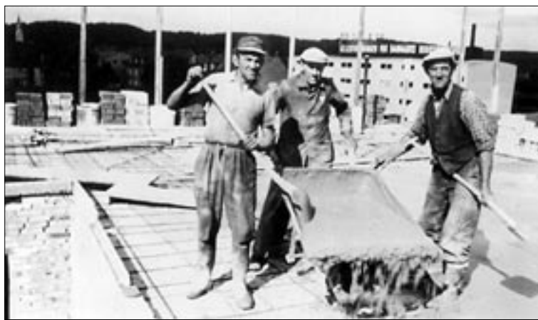
Linnemanns Jomfrukloster omkring 1950