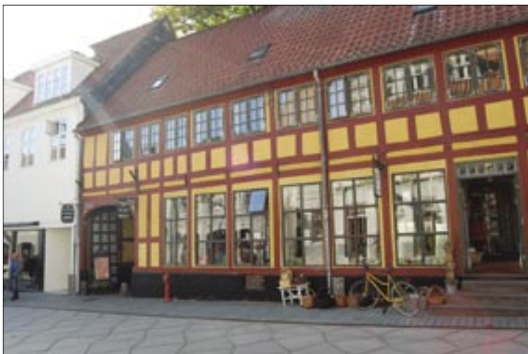
Foto af Den Smidtske Gård, Søndergade 14