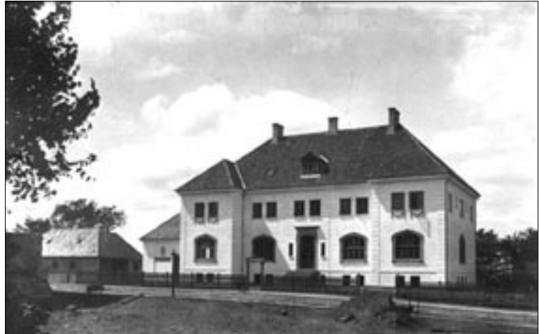
Øverst den gamle amtsgård, nederst den nye amtsgård