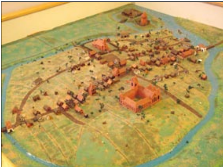
Foto af model af Vejle by med Sct. Nicolai kirke øverst midt for

vindebro. Der blev også lavet skydeskår i kirkemuren. Byggematerialerne kom fra bygningerne omkring Kirketorv. Efter kirken var blevet besat af svenskerne fra 1657 til 1659, var den meget forfalden. Hverken kirken selv eller Vejle by havde råd til at istandsætte den. Derfor blev den givet til Københavns Universitet, der havde råd til istandsættelsen. Først i 1781 var Vejle blevet rig nok til igen selv at eje kirken.