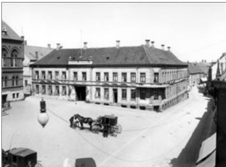
Hotel Royal i 1895

ved ikke meget om klosteret, men vi ved, at det tilhørte Dominikanermunkene, eller Sortebrødre munkene, som de også kaldtes. Denne munkeorden måtte ikke tjene penge, men skulle i stedet ernære sig gennem tiggeri. Dens opgave var at missionere blandt byens indbyggere og pleje de syge og fattige.