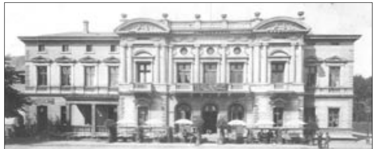
Hyggelig atmosfære omkring det tidligere Vejle Teater

Bygningen over for banegården blev oprindeligt bygget som teater. Vejle Teater blev indviet den 16. september 1884 med en smuk facade med barokinspiret udsmykning som søjler og forgyldte ege- og laurbærranker. Set fra banegården kan man i dag se to buer øverst på facaden, hvor hver bue rummer to engle, der holder en harpe og dermed symboliserer bygningens oprindelige formål. Teatret blev meget populært og havde skiftende forestillinger med omrejsende trupper og vejlensiske kunstnere. Alligevel var det svært at skaffe finansiering, og bygningen forfaldt. Under Anden Verdenskrig blev den beslaglagt af den tyske Værnemagt og var derefter i en meget dårlig stand. Først fra 1961 til 1963 blev der, i forbindelse med et ejerskifte, penge nok til en gennemgribende restaurering og bygningen fik dermed det udseende, den har i dag. Herefter fungerede bygningen som teater, indtil den i 1974 blev købt af det vejlensiske olie- og benzinselskab Haahr Benzin, der indrettede den som hovedkontor.