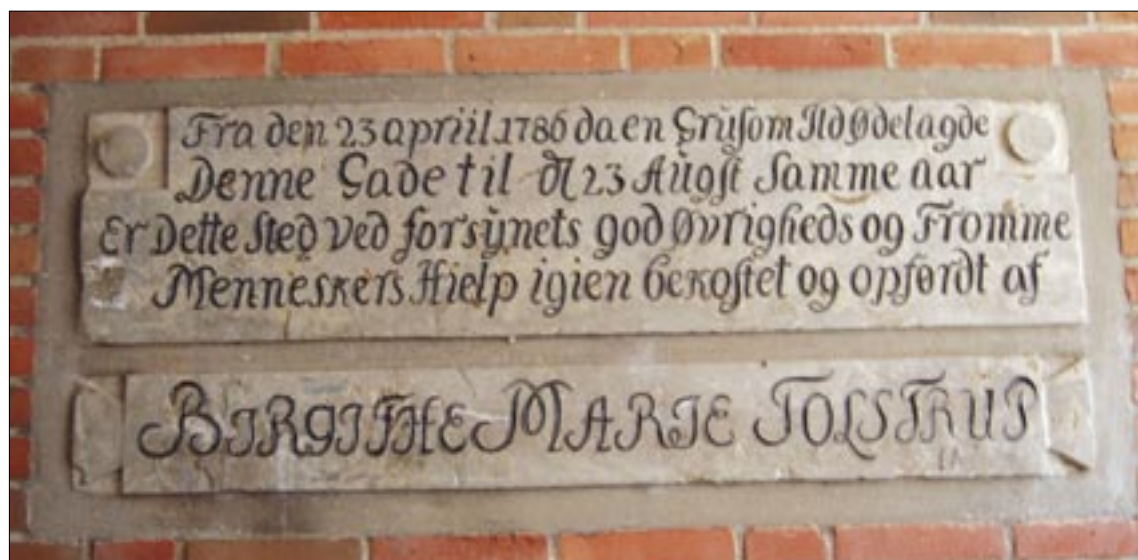
Inskriptionen over branden Nørregade 15

Hvis en ildebrand begyndte, havde Vejle Brandkorps i 1786 to trommeslagere, der skulle advare og kalde byens borgere til hjælp. Vi ved ikke præcist, hvilket brandudstyr brandkorpset havde i 1786, ud