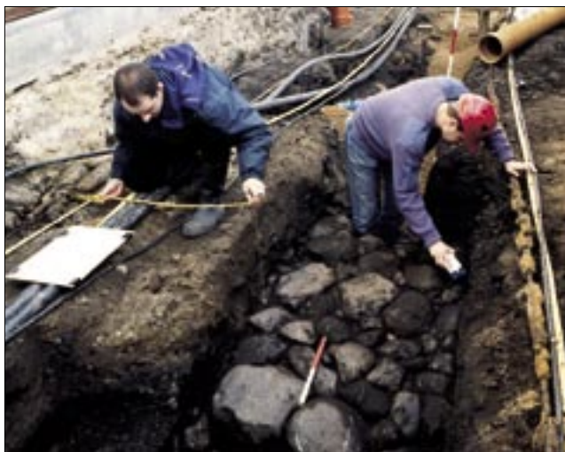
Foto fra udgravning i Torvegade i år 2000

Købmandsgårde i middelalderen havde ofte stue mod gaden, der kunne fungere som salgssted. Salget foregik gennem en stor luge, der åbnede ud mod gaden.