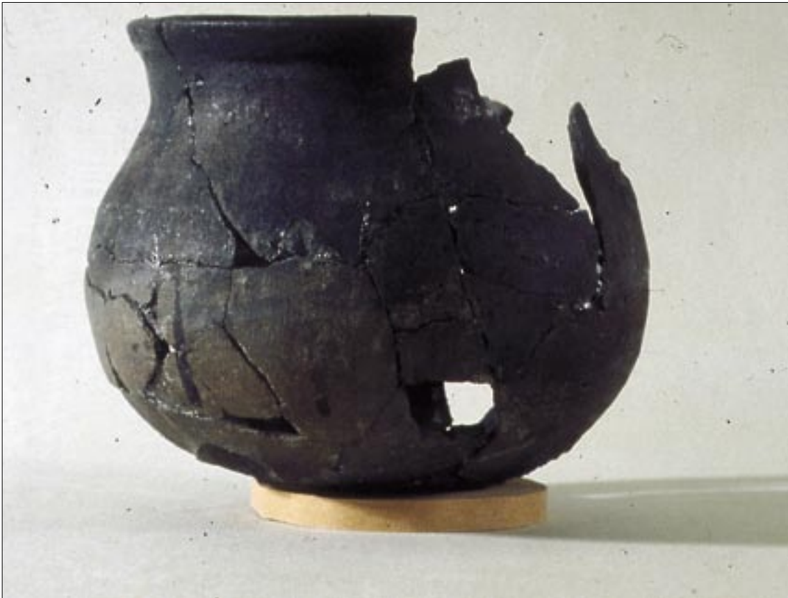
Jyttepotte fra Nørregade

møder Grønnegade. Den blev anlagt samtidig med Sortebrødreklostret i Torvegade.