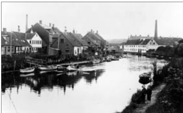
Gammelhavn set mod vest i begyndelsen af 1900-tallet

leåen en dæmning, der skulle forhindre, at åen skred ud. Det er den gade, der hedder Dæmningen i dag. For at vandmasserne i Mølleåen ikke skulle blive for voldsomme, havde Vejle to åer som aflastningsløb. I en bue nord og vest om den gamle middelalderby løb Midtåen og længere mod vest, efter engene, løb Omløbsåen. I dag er dele af Mølleåen gravet fri og man kan stadig se noget af Omløbsåen, mens Midtåen er lagt i rør og er blevet overdækket. Men man kan se, hvor den har løbet, idet den er markeret med bølger i fliserne lige før Torvegade krydses af Flegborg og Vissingsgade.