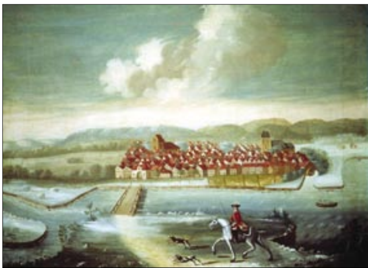
Vejle set fra syd i 1747

Nørregade blev hurtigt genopbygget. Allerede to dage efter branden blev det foreslået, at den genopbyggede gade skulle gå lige, i stedet for at sno sig. Derudover skulle den nye gade være bredere, så der var mere plads mellem gadens to sider. Den 16. maj 1786 blev det nye gadeforløb afmærket og i august var alle Nørregades bygninger, på nær to, under opbygning. For at huske branden og takke for hjælp til genopførelsen, blev der den 23. august 1786 opsat en inskription over Nørregade 15. Der ligger Føtex i dag og inskriptio-