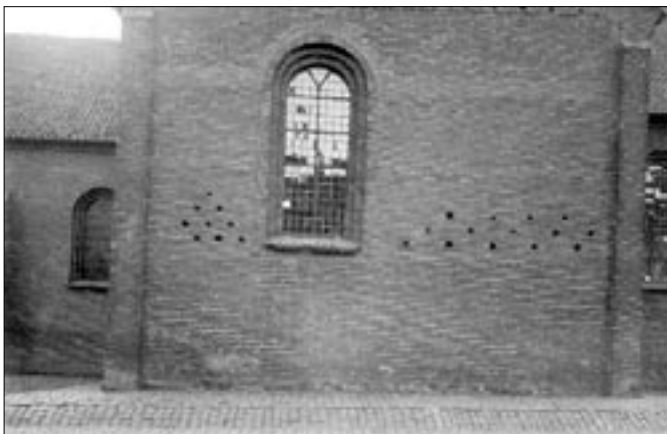
Sct. Nicolai Kirkes nordre kapel med de indmurede kranier.

vindebro. Der blev også lavet skydeskår i kirkemuren. Byggematerialerne kom fra bygningerne omkring Kirketorv. Efter kirken var blevet besat af svenskerne fra 1657 til 1659, var den meget forfalden. Hverken kirken selv eller Vejle by havde råd til at istandsætte den. Derfor blev den givet til Københavns Universitet, der havde råd til istandsættelsen. Først i 1781 var Vejle blevet rig nok til igen selv at eje kirken.