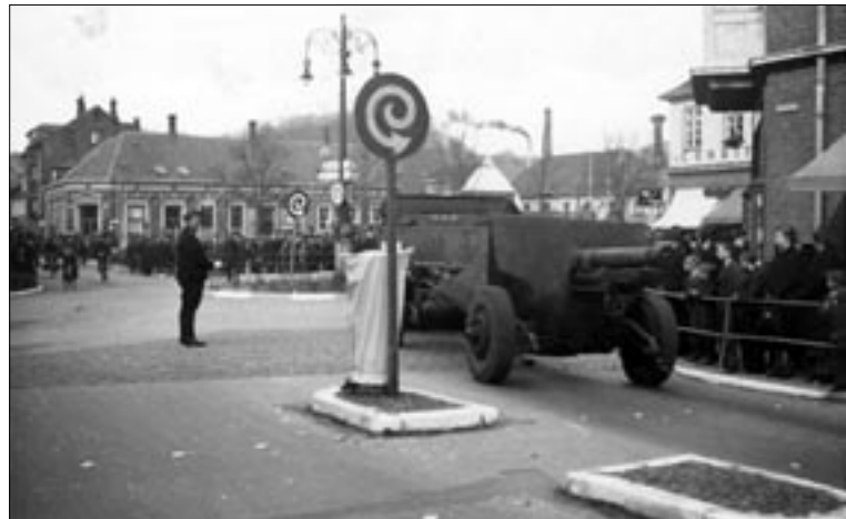
Tyskerne ankommer til Nørretorv 9. april 1940

Svaneapotekets bevilling udløb i 1917, uden at der var en apoteker til at forny den. Samtidig på Sct. Thomas på de Vestindiske Øer mistede apoteker O.V. Poulsen sin bevilling, da Danmark solgte øerne til USA. Poulsen fik derfor som kompensation fra den danske stat Svaneapotekets bevilling, og den 15. juni 1917 åbnede St. Thomas Apotek med Svaneapotekets gamle varelager og inventar. Svaneapoteket fik imidlertid en fornyet bevilling, og den 5. december 1919 blev Svaneapoteket genåbnet i lokaler lige over for St. Thomas Apotek.