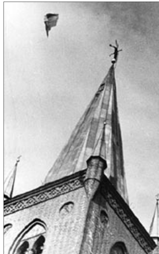
Dannebrog falder ned fra himlen den 5. maj 1945

Når man lige er kommet ind i selve kirkeskibet, hænger der til venstre et indram-