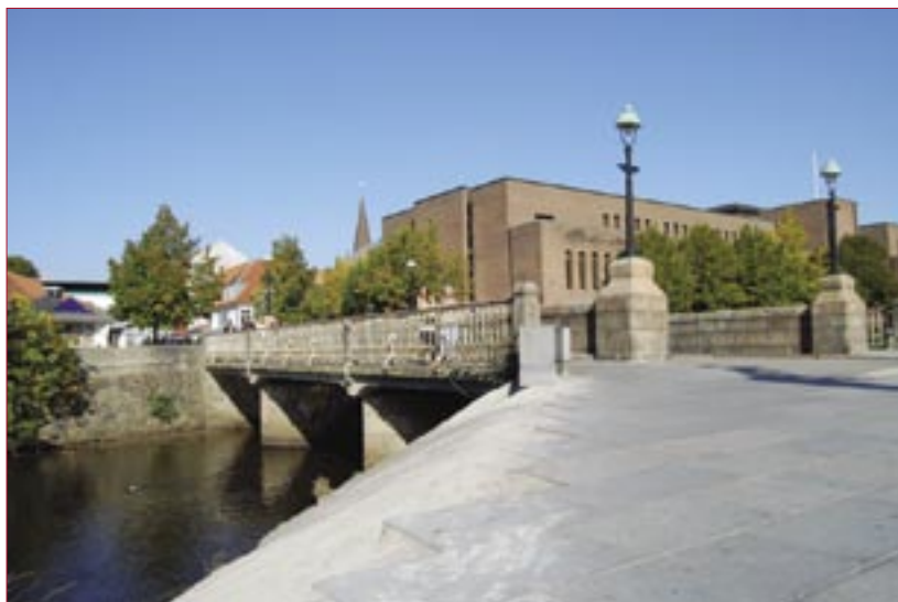
Sønderbro, billedet er taget i år 2008