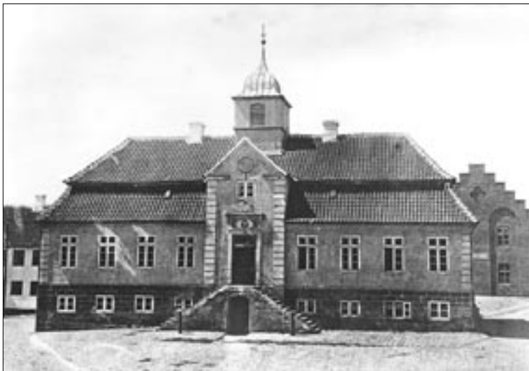
Vejle Rådhus i 1860'erne