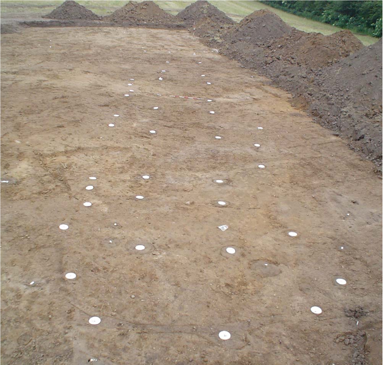
Fig. 3. Hus A278 set fra ca. vest.

Huset var bevaret i en længde af 21,5 m og en bredde af 5,5 m. Huset er bevaret i form af både de indre tagbærende stolper og vægkonstruktionen. Væggen var sporadisk bevaret i form af tætstillede stolper. Huset skal ud fra typen dateres til yngre romertid/ældre germanertid.