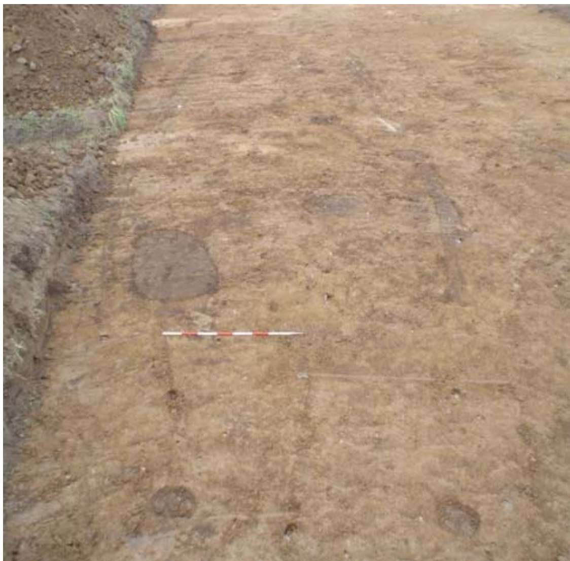
Fig. 2. Husene A193 og A194 set fra ca. øst.

Da de to huse er meget ens konstruktion og desuden lå umiddelbart oven i hinanden tolkedes de som et hus i to faser. Husene var bevaret i en længde af henholdsvis 18,5 m og 18 m og en bredde af 5,5 m og 5 m. Husene er bevaret i form af både de indre tagbærende stolper og vægkonstruktionen. I den ene af faserne var væggen baret i form af en væggrøft, mens den der i den anden fase blev registreret både en væggrøft samt tætstillede stolper i vægforløbet. Husene var af samme type som dem, der blev fundet ved undersøgelsen af Trelleborg, og skal derfor dateres til sen vikingetid/tidlig middelalder.