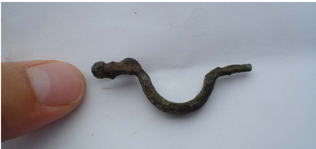
Fig. 4. Bronzefibel X24.

Der er tale om en mulig grav/dårligt bevaret grav. Der var tale om et 230 cm langt og 70 cm bredt fyldskifte. I graven fremkom et uidentificeret metalstykke X36. Graven var kun bevaret i en dybde af 14 cm, hvilket kan skyldes nedpløjning. Det er derfor muligt, at bronzefibel x24 (se fig. 4), der blev fundet med detektor i pløjelaget umiddelbart øst for graven, oprindeligt stammer fra denne. Graven er samtidig med bebyggelsen fra yngre romertid/ældre germanertid.