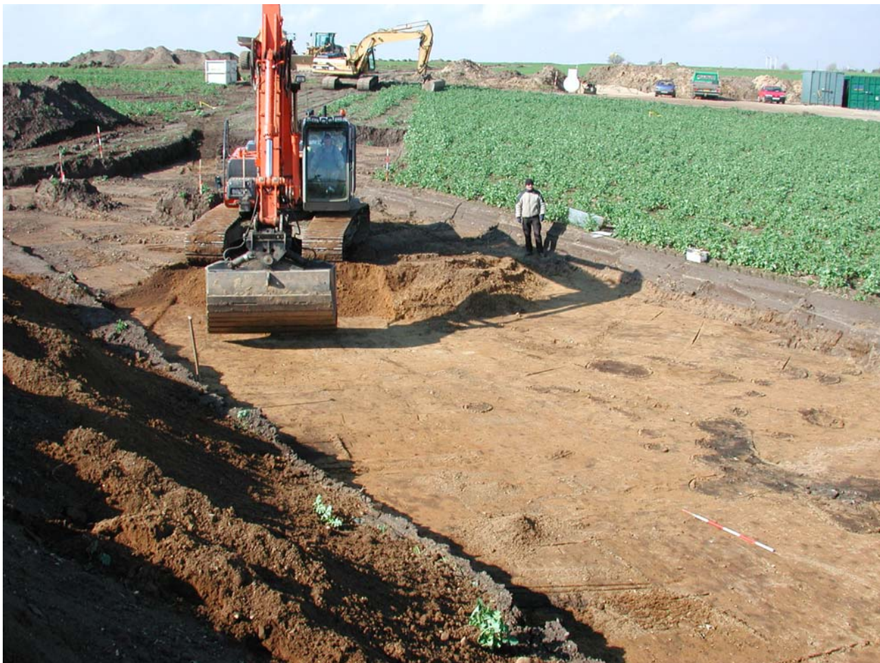
Fig. 3 Anlæg fra ældre bronzealder under afgravning.

Hovedparten af anlæggene daterer sig til yngre romertid (ca. 200-350 e.Kr.) og germanertid (ca. 350-800 e.Kr.). Men der registreredes også spor efter bebyggelse fra ældre jernalder (500 f.kr. til 200 e.kr.), ældre bronzealder (1400-1200 f.kr.) samt middelalderlige marksystemer i form af agerren.