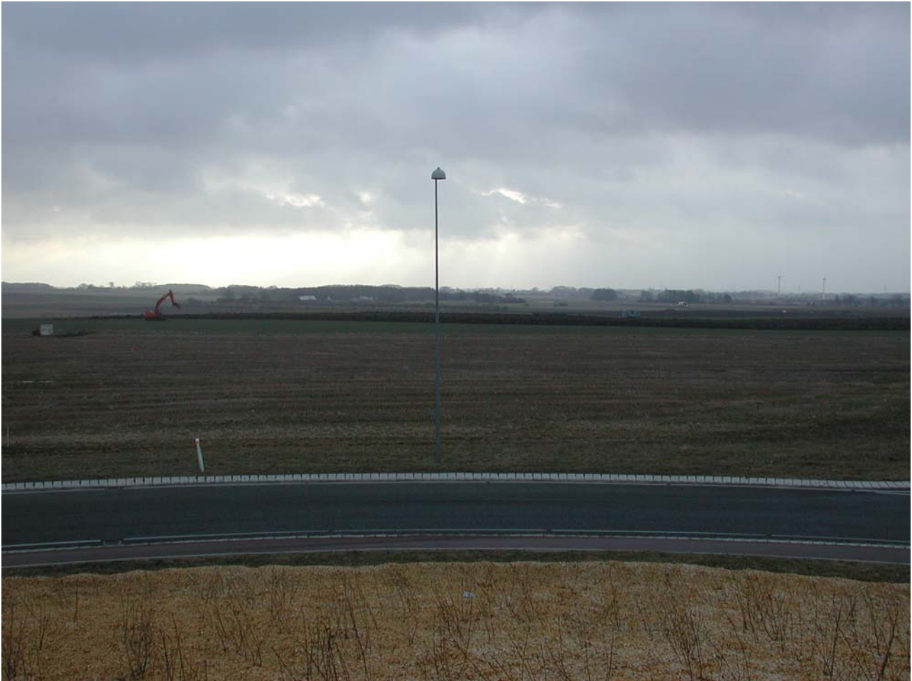
Fig. 1. Det undersøgte område set fra ca. vest.