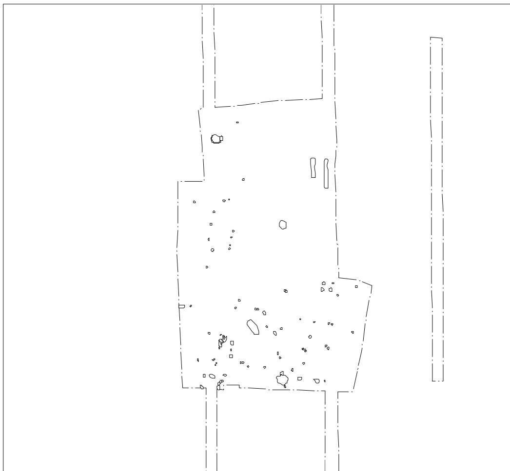
Fig.1. VKH 6822 Riis Mark udgravningstegning.