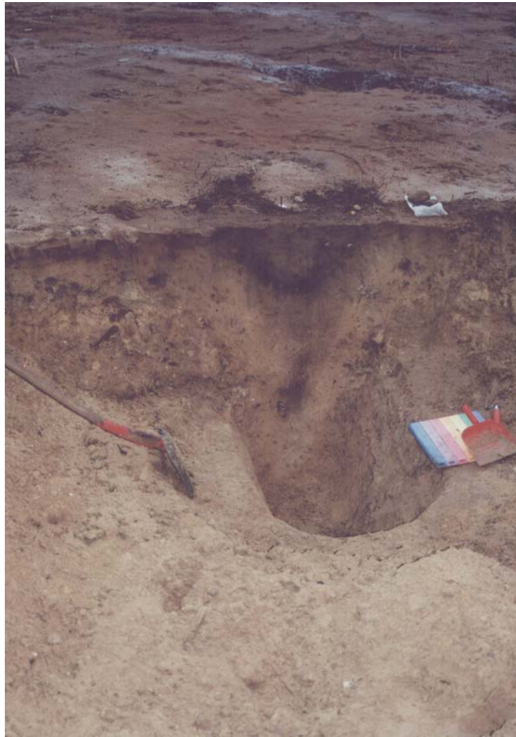
Fig.3. Stenaldergrube A26 under udgravning.

Af de i alt 37 keramikskår, var de 7 skår ornamenteret i Fuchsberg-stil, i et mønster af fladedækkende storvinkel bånd, i vandret indtryk af beviklet snor, hvor også konturlinien er i indtryk af beviklet snor. Vinklerne mødes i et V. Det kan dreje sig om en åben, enleddet Fuchsberg skål. En bred randøsken ( 4 cm lang) stammer formodentlig fra samme kar, samt to små randskår. Alle skårene er rødlig i farven, godt brændt og magring af knust granit. Desuden var der to skår med udsmykning af pålagte lister, de kan stamme fra samme skål eller fra en kraveflaske. Et randskår har lidt fortykket rand på ydersiden og derunder vandret indtryk af tosnoet snor. To skår har ornamentik i to lodrette streger. Alle de i alt 37 skår må stamme fra minimum tre lerkar. Fuchsberg keramikken dateres til TN II, Tidlig Neolitikum, tidlig yngre stenalder. Ca. 3500 – 3300f.Kr.