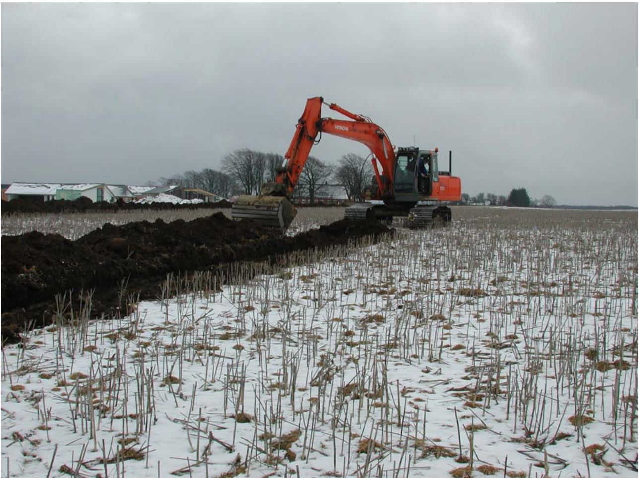
Fig. 1. Det undersøgte område set fra ca. nordvest.