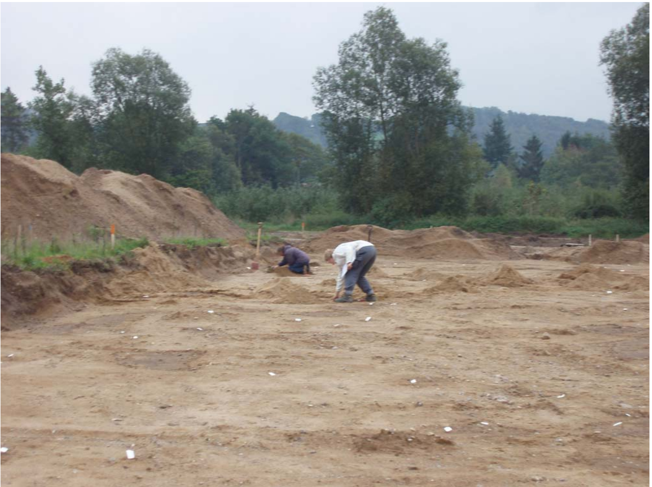
Udgravning af anlæg ved boligvej 2.

Muldlaget er ret tykt, stedvis 30 – 40 cm, bortset fra på bakketoppen hvor det bliver tyndere.