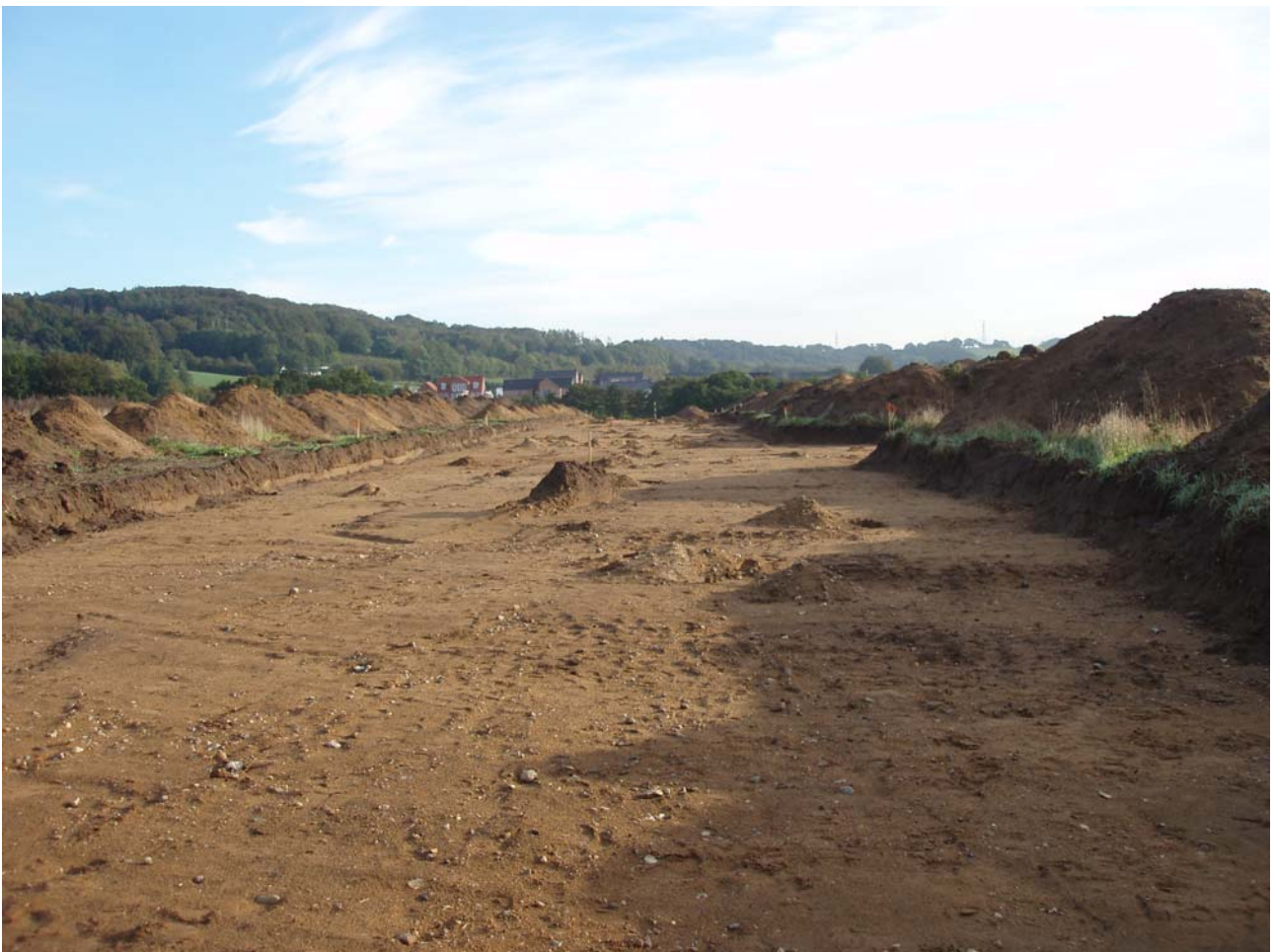
Udsigt fra stamvejen mod øst.